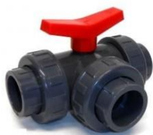
3 Válvulas unidireccionales 3/4"