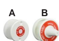
Puntos de muestreo

Puntos de prueba Parte A: RP5226 Parte B: RP5242