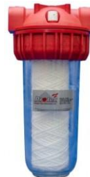
Filtro de polvo de trabajo pesado