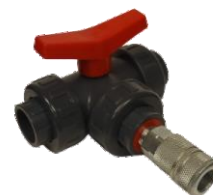
Válvula de escape de 3 vías