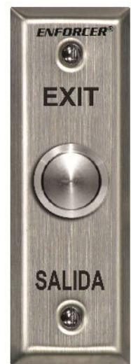
Placa Angosta SD-7104SGEX1Q