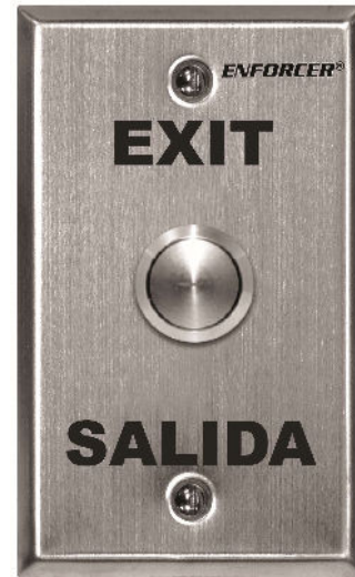
Placa singular SD-7204SGEX1Q