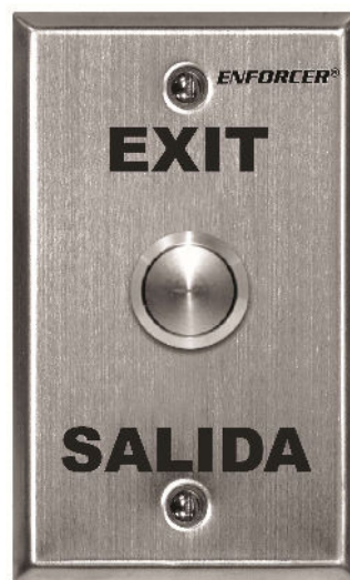
De una sola banda SD-7204SGEX1Q