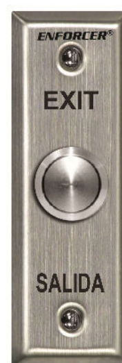
Que no engorda SD-7104SGEX1Q